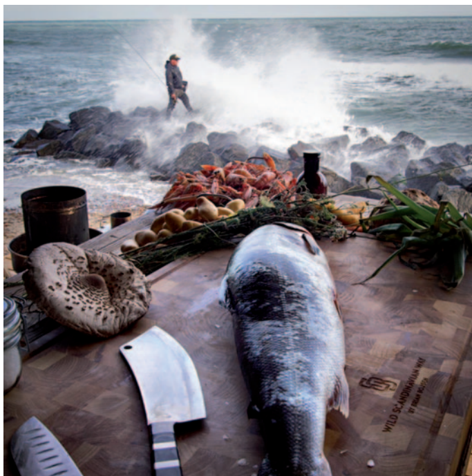
Gekrösemesser ErgoGrip Gut and Tripe Knife ErgoGrip