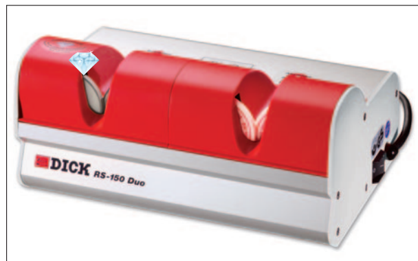
Schleifmaschine mit Abziehvorrichtung für höchste Ansprüche DICK RS-150 DUO

Ausführliche Informationen über unser Sortiment senden wir Ihnen gerne zu.