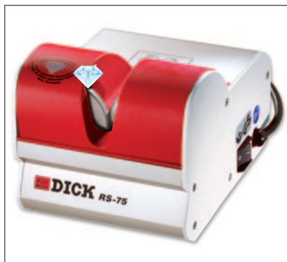
Schleifmaschine DICK RS-75

Als führender Messerhersteller hat Friedr. Dick natürlich auch Kompetenz in Sachen Schärpen für alle Messertypen. Beim Schleifen von Handmessern gibt es die unterschiedlichsten Anforderungen. F. Dick bietet individuelle Lösungen z. B. für den Küchen- und Ladenbereich: