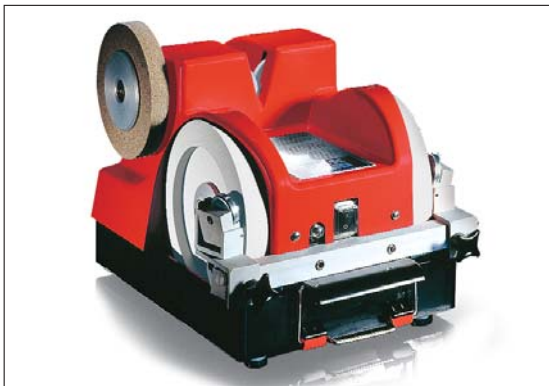
Schleif-, Abzieh- und Poliermaschine DICK SM-111

Als führender Messerhersteller hat DICK natürlich auch Kompetenz in Sachen Schärfe für alle Messertypen. Beim Schleifen von Handmessern gibt es unterschiedlichste Anforderungen. DICK bietet individuelle Lösungen z. B. für Fleischer-Handwerk und Industrie: