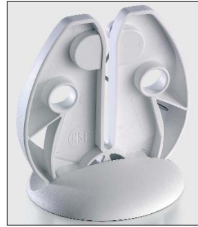
Hygienisches, geschlossenes Federsystem