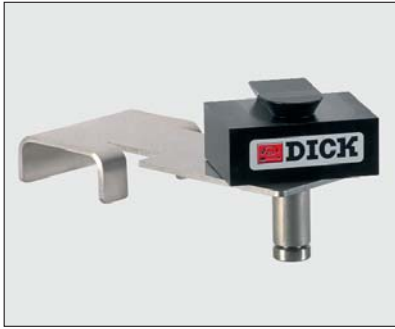
Zubehör: Halter zum Befestigen am Arbeitsplatz Art.-Nr. 9 0081 02