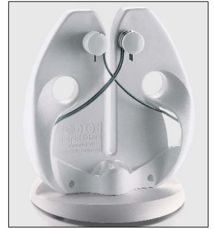
Zubehör: Standplatte Art.-Nr. 9 0081 06-05