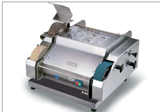
Universalschleifmaschine DICK SM-160 T